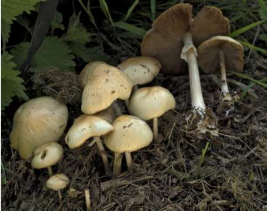
Fig 6.1. Agrocybe rivulosa Nauta