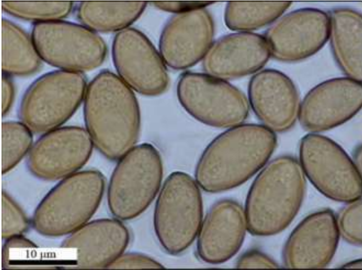
Fig. 6.2. Esporas. Agrocybe rivulosa Nauta